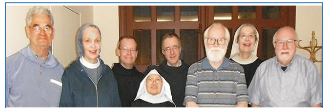
¡La gente que hace posible el trabajo de la AIM! ¡Gracias!

La AIM responde a las necesidades apoyando a las comunidades en su origen, crecimiento, desarrollo, pruebas y dificultades. La AIM estimula la reflexión sobre los retos que afrontan la vida monástica actual en los campos de la educación, pobreza, medio ambiente, justicia y paz.