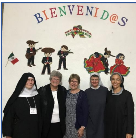
Miembros del Consejo Administrativo de la CIB en la reunion de Cuernavaca, Mexico