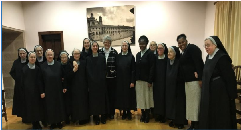
Con la comunidad de San Pelayo, Santiago de Compostela

¡Este tiempo de peregrinación supuso una bendición para mí! La experiencia de communio con las hermanas españolas de San Benito (las benedictinas) fue palpable. Cada casa me recibió con los brazos abiertos y con una cariñosa hospitalidad benedictina. En cada monasterio que visité, compartí sobre la CIB haciendo hincapié siempre en la primera palabra de las siglas CIB, COMMUNIO . Fue un tiempo sagrado para mí que me regaló un sentido más fuerte de la sororidad que compartimos en nuestra antigua Orden de San Benito. Las Benedictinas de España viven la Regla de San Benito con fidelidad y belleza.