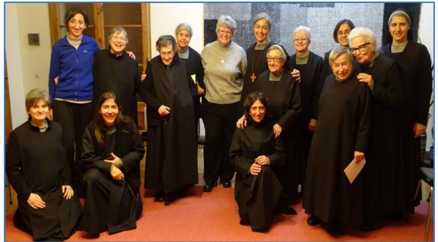
Comunidad del Monestir de San Benet de Montserrat