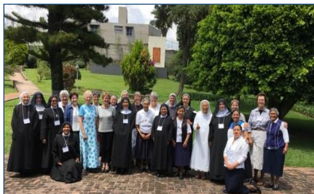
Participantes en la Conferencia de Delegadas de la CIB reunidas en Cuernavaca en el centro de retiro de las Misioneras Guadalupanas de Cristo Rey, OSB en September 2019.

¡Cómo puede haber pasado ya un año desde el simposium de la CIB celebrado en San Anselmo, Roma, y ahora meses desde la Conferencia de Delegadas de la CIB reunida en Cuernavaca, México! ¡Quizá es que a mi edad el tiempo pasa rápido! Sin embargo, por muy rápido que haya pasado, personalmente ha sido un tiempo muy rico para mí ya que he mantenido correspondencia y me he encontrado con muchas benedictinas buenas y leales de todo el mundo.